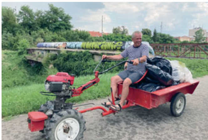
Uklidili jsme nábřeží Svitavy před festivalem.

Ve chvíli, kdy čtete tento článek, se odehrál 7. ročník festivalu na nábřeží Svitavy Překročíme řeku. Svitava, zregulovaná před více než 150 lety do podoby strmých koryt procházejících dnes z velké části zavřenými průmyslovými areály, je vedle Svatky brněnskou říční Popelkou. Možná je menší, ale není méně důležitá. Kolem ní se rozkládal důležitý průmysl i společenské dění. Krůček po krůčku se daří jednotlivé úseky oživit, ukazovat, co vše je kolem řeky zajímavé, co se u ní dá zažít a hlavně pro-