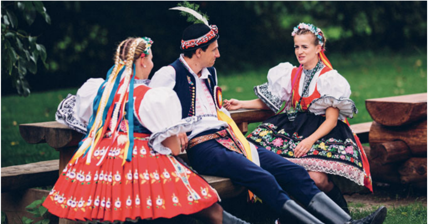
Nenechte si ujít letošní hody. Podrobný program najdete na straně 3. Těšíme se na vás.